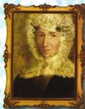
Nicolas et Justyna Chopin